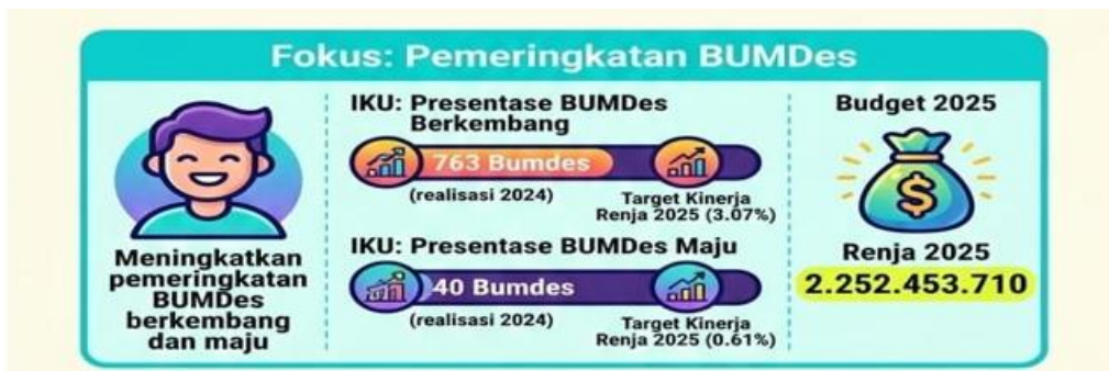
Gambar 1. Matriks Perencanaan Berdasarkan Renstra 2025-2026

Komitmen Dinas PMDT dalam meningkatkan kualitas BUMDes tercermin dalam target kinerja yang telah ditetapkan pada tahun 2025. Dari total 2.435 BUMDes yang ada di Provinsi Lampung, jumlah BUMDes Berkembang pada tahun 2024 tercatat sebanyak 763 BUMDes. Pada tahun 2025, pemerintah menargetkan peningkatan sebesar 3,07% dari total BUMDes yang ada atau sekitar 75 BUMDes. Dengan demikian, jumlah BUMDes Berkembang yang ditargetkan pada akhir tahun 2025 mencapai 838 BUMDes. Di sisi lain, peningkatan status BUMDes Maju juga menjadi fokus utama program inkubasi. Pada tahun 2024, jumlah BUMDes yang telah berstatus Maju tercatat sebanyak 40 BUMDes. Melalui berbagai program pembinaan dan pendampingan, Dinas PMDT menargetkan peningkatan sebesar 0,61% dari total BUMDes atau sekitar 15 BUMDes pada tahun 2025. Dengan target tersebut, jumlah BUMDes Maju di Provinsi Lampung diharapkan meningkat menjadi 55 BUMDes pada akhir tahun 2025.