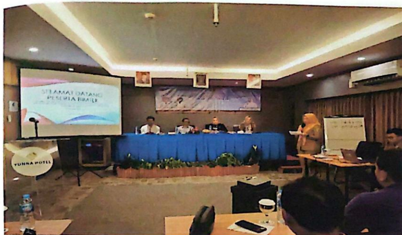
Gambar 3. Dokumentasi Bimtek Peningkatan Kapasitas Bum Desa Pelaksanaan Program Hasil Terbaik Cepat (Phtc) Gubernur Dan Wakil Gubernur Lampung Tahun 2025.

Bimbingan Teknis (Bimtek) merupakan salah satu pilar intervensi strategis yang dilakukan oleh Dinas Pemberdayaan Masyarakat, Desa dan Transmigrasi (PMDT) Provinsi Lampung dalam penguatan BUMDes Maju sebagai penggerak perekonomian lokal. Kegiatan ini dilaksanakan sebagai upaya untuk meningkatkan kapasitas pengelola BUMDes sekaligus memperkuat penerapan prinsip-prinsip Good Corporate Governance (GCG) dalam tata kelola usaha desa.