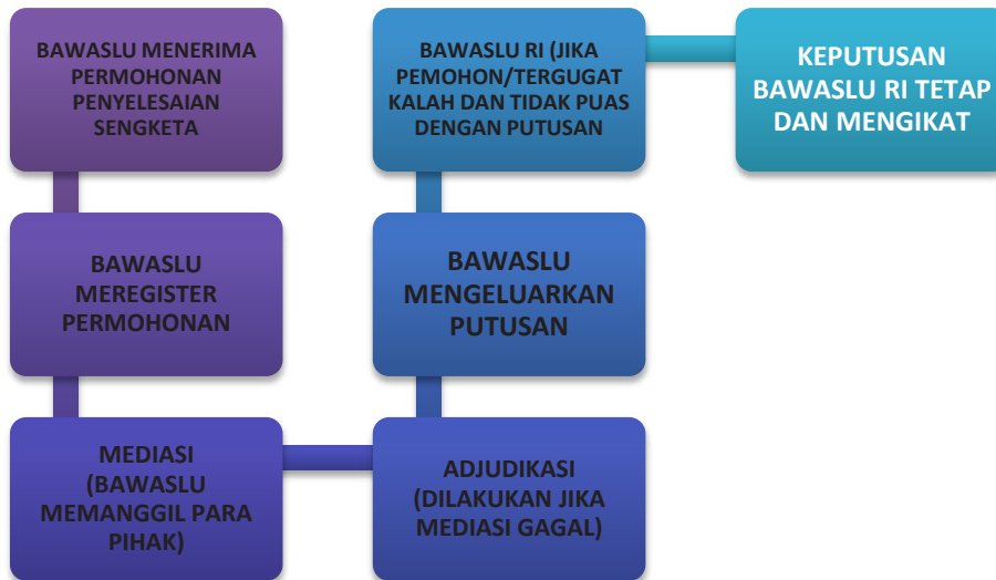
Gambar 2. Alur Adjudikasi